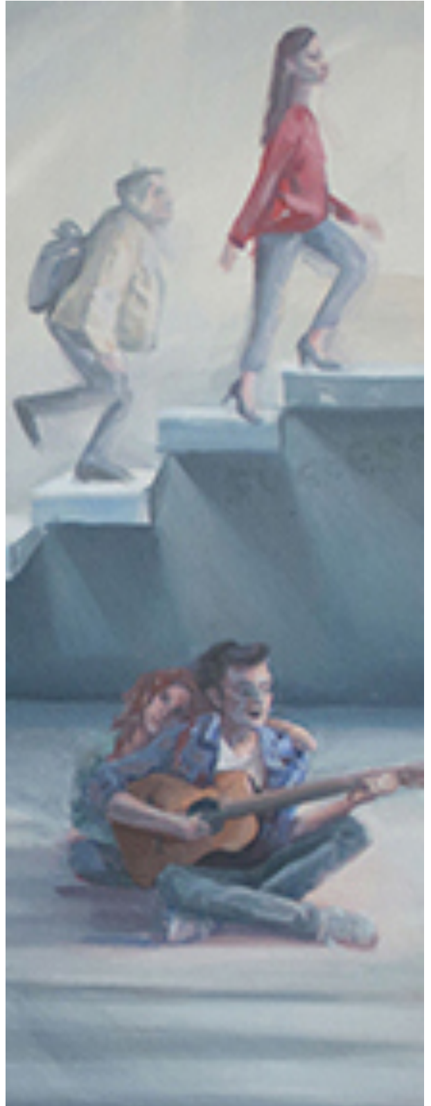
Société Civilisée 2021 H/T 90x120 cm (détail)

Son style s'apparente à l'art figuratif peignant principalement de grands portraits. Des expressions de visage généralisées sur de grandes toiles nous confrontent directement et nous entraînent dans l'émotion humaine. Parfois, ces expressions sont fortes, mais plus souvent très subtiles et sophistiquées parce que tout n'est pas évident dans la nature humaine. Il y a beaucoup de couches plus profondes et de complexité dans la psychologie humaine, et donc en portrait. Elle tend à présenter cette ténuité, sans juger d'attitude. Quand il s'agit de peintures avec des caractères multiples, l'accent est davantage sur l'atmosphère, l'espace qui les entoure, la scène, mais, qui reflète également leurs qualités et leurs relations mutuelles. Lorsque les sujets ne sont pas des personnes et des portraits, que ce soit un environnement quotidien ou des objets, l'accent est toujours mis sur l'atmosphère de la peinture. Elle essaie de "saisir un moment" dans le temps, la scène précise et le sentiment, qui passera la seconde suivante. En ce sens, le style contient une dose d'impressionnisme moderne. Les couleurs vives, ouvertes et ambiantes s'expriment par le jeu de la lumière et des ombres.