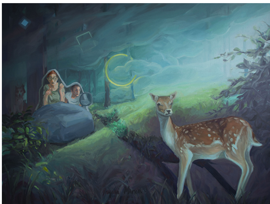
Peur Sans Raison - 2020 - huile sur toile - 90x120 cm

Contact PRESSE - Christine Paulvé 06 80 05 40 56 Visuels à télécharger sur christinepaulve@me.com rubrique à venir