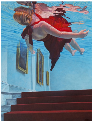
Ivana Zivic - Le Musée - 2016 - huile sur toile - 150x115 cm

Les espaces qui apparaissent dans les peintures d'Ivana Živić, présentées pour la première fois au public parisien, représentent des salles et des palais que nous connaissons tous, comme le château du Spitzer à Beočin, le château de Versailles à Paris ou encore des salles de musée, comme celle du Louvre. L'espace est réaliste, mais l'artiste le mystifie, en faisant un espace de notre mémoire, un espace qui nous ramène aux événements et aux sentiments vécus. L'intérieur de l'âme et de la mémoire sur les toiles d'Ivana Živić est rempli d'eau qui fait vibrer la lumière, mettant l'accent sur nos émotions, nos souvenirs et nos rêves que nous recherchons.