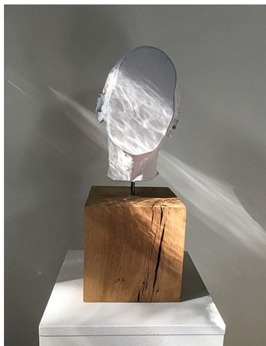
Identity A la recherche d'un visage, valse hésitations, ... Mousse PU, silicone, bois, tige en fer 50 x 23 x 20 cm