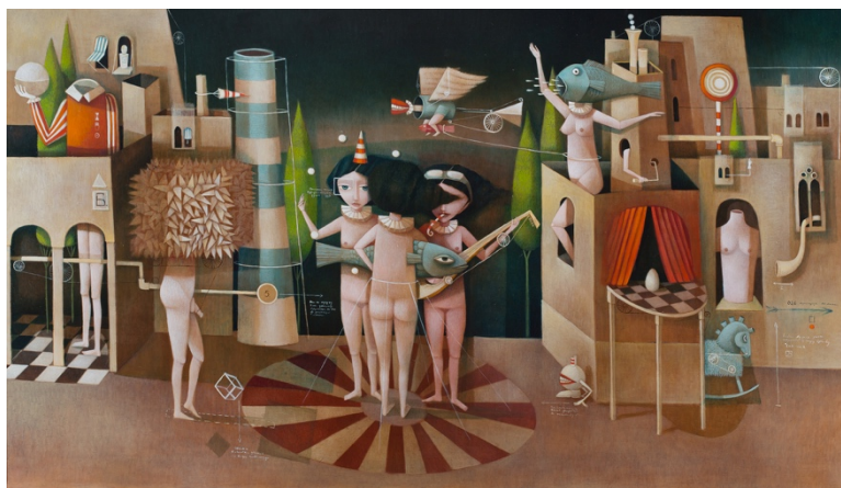
Snezana Petrovic/ Improvisation 2019 / huile sur toile / 80 x 140 cm.

Neda Arizanovic / Tijana Kojic / Damjan Kovacevic Dragana Markovic / Radomir Milovic / Kristina Pirkovic Snezana Petrovic / Milos Vukovic / Djordje Savic