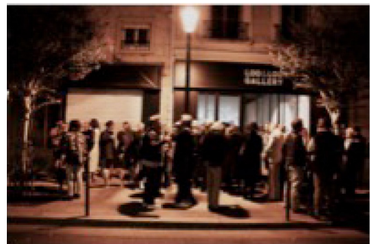
Vernissage Guru © Jean Merhi

Bruno Blossé +33 1 42 74 03 97 www.looandlougallery.com bblosse@looandlougallery.com