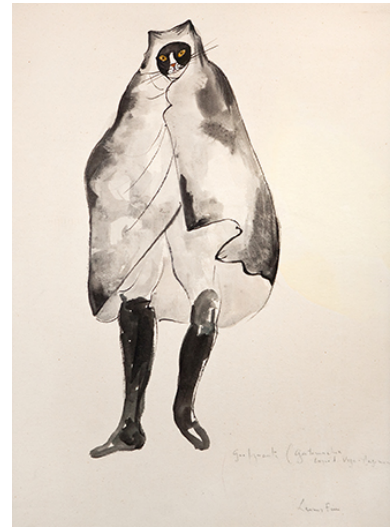
Gattomachia, aquarelle et gouache, 41x31 cm