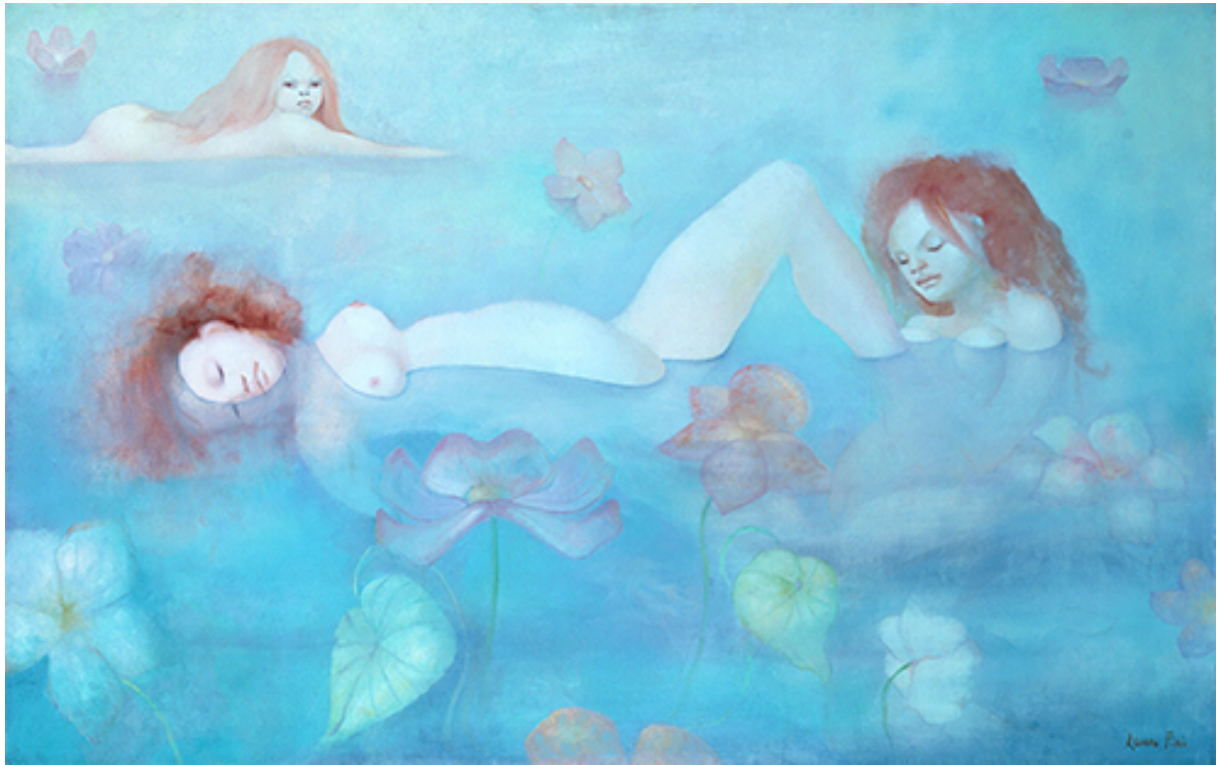
Les baigneuses 1972 huile sur toile 73 x 118 cm

Née à Buenos Aires le 30 août 1907 , elle passe son enfance à Trieste avec sa mère et son oncle qui fréquentent l'intelligentsia triestine : Italo Svevo, Umberto Saba, James Joyce . Elle ne fréquente aucune école et sa formation est entièrement autodidacte.