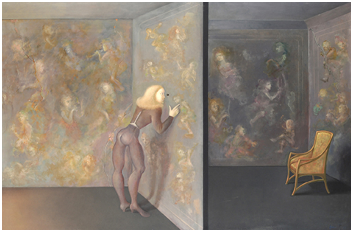
Une grande curiosité, 1983. H/T , 97x146 cm

En 1960, Leonor s'installe avec de nombreux chats, dans un grand appartement-atelier rue La Vrillière, entre le Palais Royal et la Place des Victoires où elle résida et crée sans cesse, jusqu'à son décès le 18 janvier 1996.