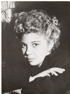
Leonor Fini photographiée par Dora Maar 1937

Peintures de 1930 à 1990... Cabinet de dessins érotiques Costumes et décors de théâtre