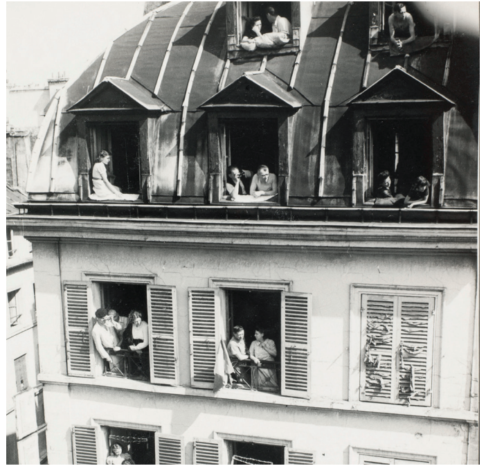
Libération de Paris, 1944