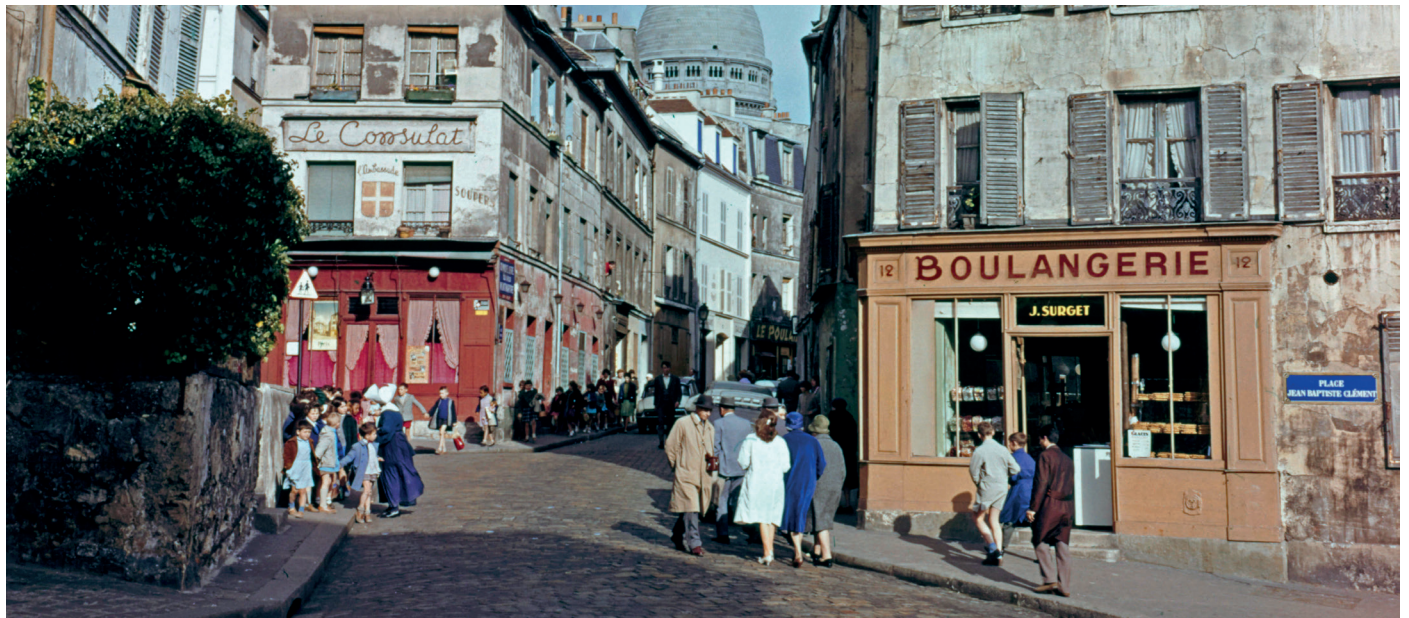
Scène de Montmartre, 1960