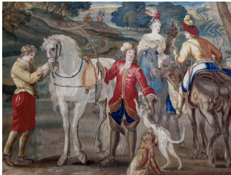
Galerie JABERT. Détail d'une tapisserie de Bruxelles (départ à la chasse). Epoque XVII ème siècle

Visuels à télécharger sur www.christinepaulve.com