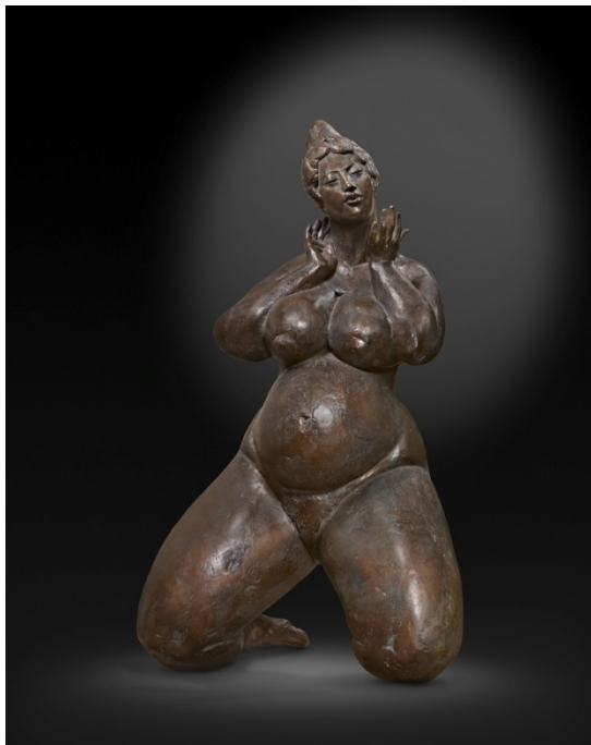
« Belle Attente », Bronze, h. 100 cm