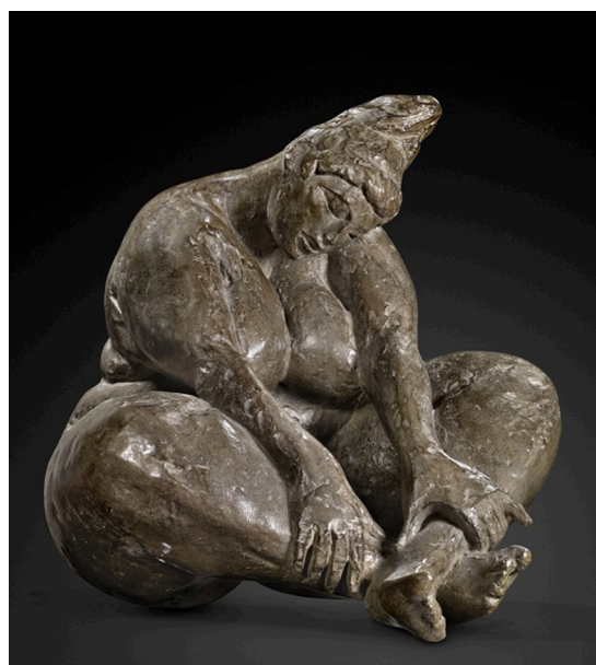
Belle rêveuse , bronze, H. 80 cm.