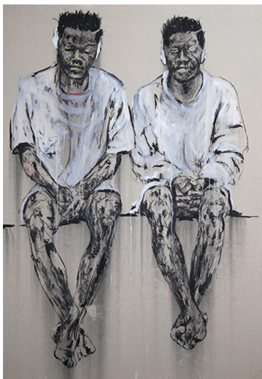
Fusain, peinture à l'huile et pastel sur toile de lin belge.2019