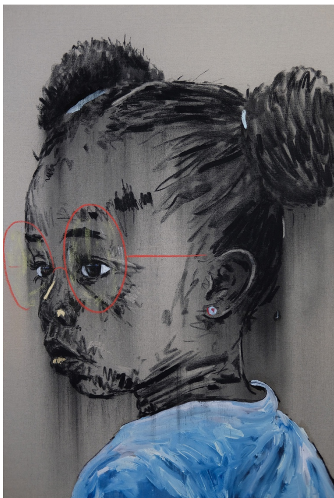
Fusain, peinture à l'huile et pastel sur toile de lin belge.