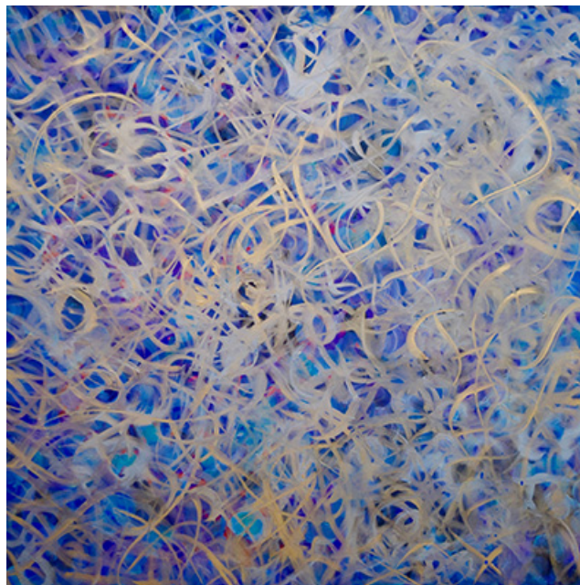
Illusive Thoughts 122X122 cm 2019 ©Laurel Holloman

«Je sens que mes peintures ont un langage secret né de la science et de mon obsession du pourquoi et du comment nous sommes ici. Je peins dans l'abstraction avec des notes subtiles de l'imagerie des éléments : le Ciel, l'Eau, le Feu, la Terre, le vol d'un oiseau, des cellules en reproduction ou le lit céleste des étoiles. Je suis obsédée par les pigments métalliques et par les effets de texture et je joue avec des touches de pinceaux pour donner à mes peintures une troisième dimension et explorer l'émotion.» L.H.