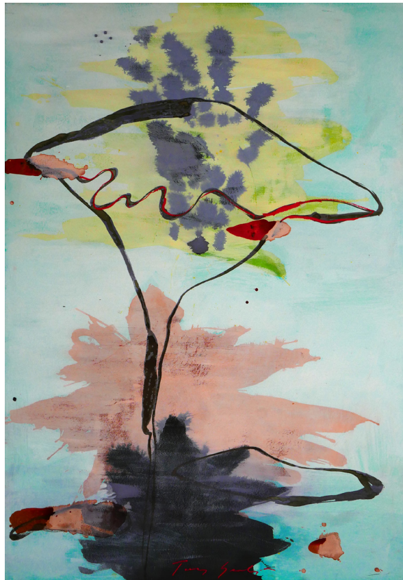
Tony Soulié, Captive , 180 x 125cm, tech. mixte, 2018