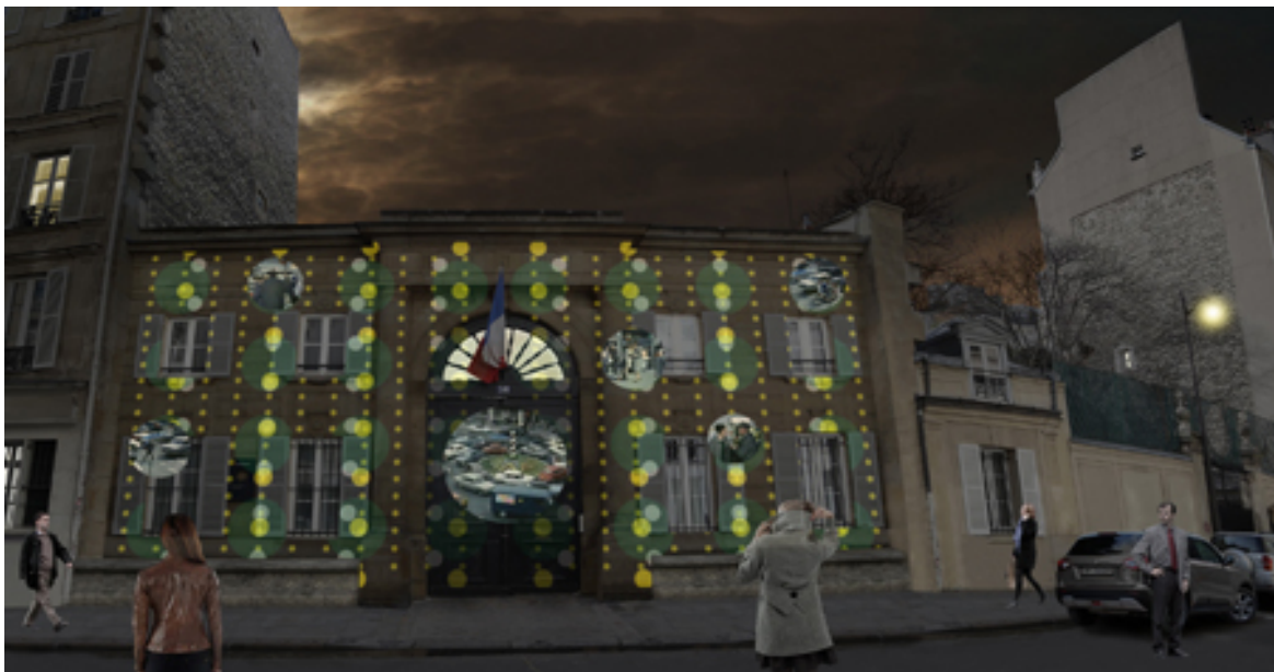
Façade 34 rue Vaneau

La lumière nous rend tous, en tant qu'observateurs, co-créateurs d'une mise en forme. Elle est l'indispensable à la vue, à la perception des couleurs, à la production des images au sein de nos esprits. Elle nous lie ainsi par un regard commun. Par des regards communs. Elle est cette passerelle qui place toute chose comme apparente, sensible, puis intelligible. Elle est aussi cette croisée des chemins artistiques visuels : existe-t-il une peinture sans lumière ? une photographie sans soleil ? une sculpture sans ombres ? un objet sans reflets ni contours ? un film sans persistance d'impressions lumineuses ? Elle est cette énergie primordiale et collective, à la fois prodigieuse et familière. Travailler cette matière est alors, pour le sculpteur-lumière Patrick Rimoux, un choix d'universel, un chemin à la source de nos sens. Provoquer nos émotions frontalement. Emporter un regard. Éveiller poésie et réflexion. Là au cœur des villes et des bâtiments, il crée des œuvres ouvertes à tous les yeux, à toutes les pensées.