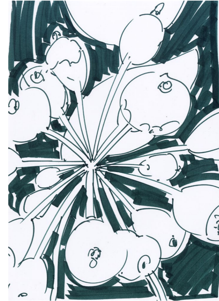
▲ Idir Davaine - Untitled, Feutre sur papier, 20x30 cm, 2017