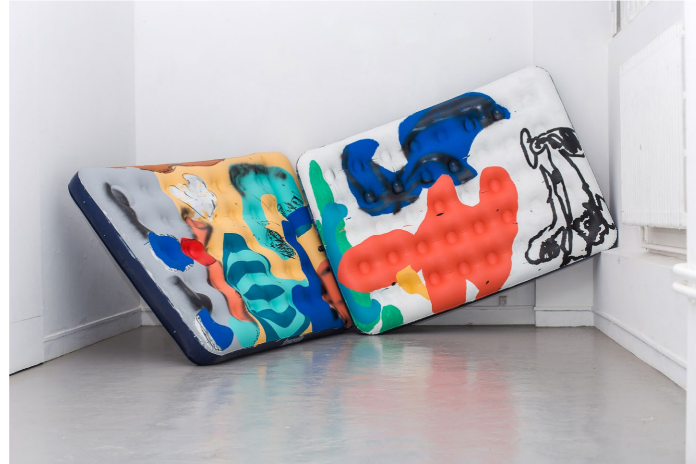
▲ Antwan Horfee - Vue de l'exposition « Choséité »