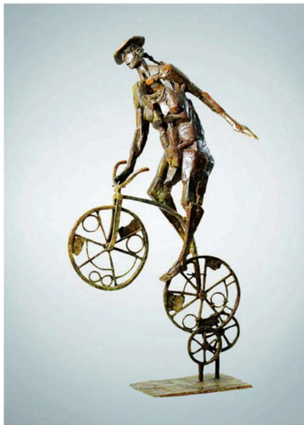
« Souvenir de jeunesse » 2014 69x34 cm

Toute l'œuvre de JIVKO fait appel à son imagination, son inventivité, sa poésie et son exigence. La figuration qui naît de ses mains et son esprit est au-delà des modes et des tendances, deux mots qui ne l'intéressent pas. Il se sent contemporain des sculpteurs de l'Antiquité et des artistes de notre siècle. Les mythes ne sont pas des « histoires à part », mais des récits qui s'inscrivent dans notre vie moderne, la réalité dépassant bien souvent la fiction des légendes. Il exprime ainsi une pensée éternelle qui concerne notre mémoire collective.