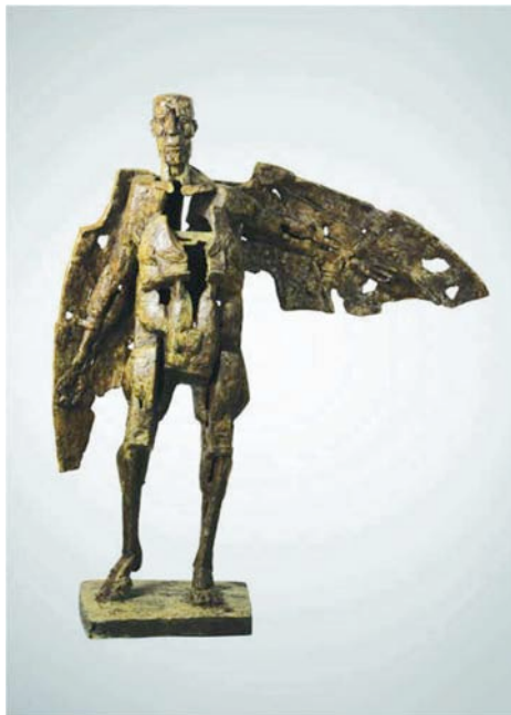
« Rêve d'Icare » 1998 110x112 cm

Les centres d'intérêt de ce sculpteur d'exception sont étonnamment variés, excessivement complémentaires et dépassent allègrement la simple représentation figurative que JIVKO nous propose. Il traite avec un égal bonheur, la mythologie et les légendes, la mélancolie et la joie de vivre, l'homme, l'animal, l'anthropomorphisme, la réalité éphémère et poétique... Mais il existe un fil conducteur qui part de son cœur pour animer chacune de ses œuvres. Tout y est magnifié et sublimé et c'est cela qui donne cette puissance si particulière qui émane de ses sculptures. Au-delà de l'apparence du sujet, JIVKO s'acharne à inscrire dans ses œuvres la vérité de la vie, l'essence même de ce qui a présidé à l'élaboration du monde : de là à dire que l'œuvre de JIVKO tutoie le sacré, il n'y a qu'un pas !