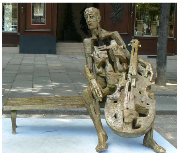
« Après le concert », bronze 2014.

Vernissage en présence de l'artiste : le dimanche 18 juin à 15h.