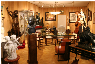
Paris - Manaus

71 • Le Cœur du Village / 06 07 83 20 06 / Généraliste XIXe et XXe siècles.