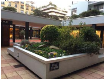
Le village Suisse, place de Berne

C'est une succession de boutiques, galeristes, bijoutiers, décorateurs, et différents spécialistes et experts de toutes époques jusqu'à l'art contemporain qui se côtoient tout au long d'allées convergeant autour de patios arborés et portant le nom de différentes villes suisses : Genève, Lausanne Lugano ... et d'une cour anglaise en sous sol. Il fait bon de s'y balader et d'y chiner !