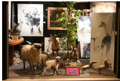
Animal Art Gallery Paris