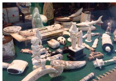
La Fille du Pirate