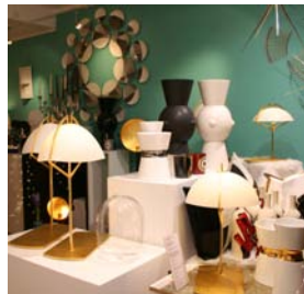
HSP – Hélène de Saint Pierre