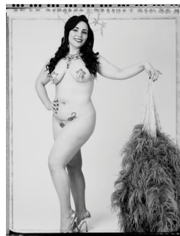
Sex Love - Paris - 2015