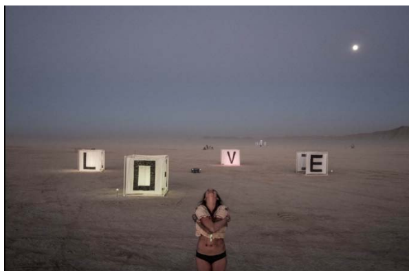
© Eric Bouvet - Burning Man - Nevada - 2016