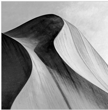
Sandrine Rousseau La Perdrea 7 Barcelone - 2014