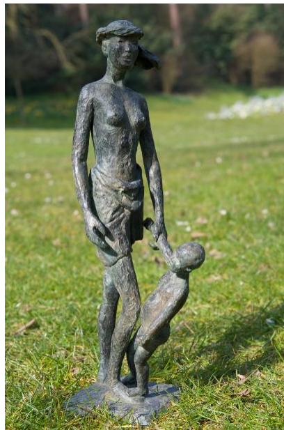
Marine de Soos La vie devant soi Bronze H 40 x 17 x 12 cm

En partenariat avec : Artistics, Artistes à venir, Des Lumières et des Ailes