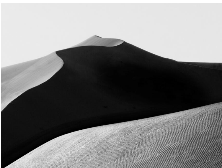
Sandrine Rousseau Sahara Désert 4 - Maroc - 2013