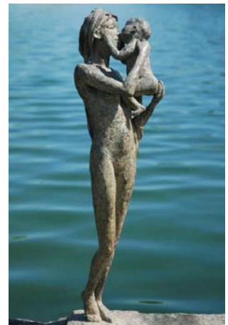
Marine de Soos Grande femme à l'enfant Bronze à la cire perdue