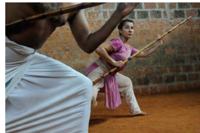
5 © Tiziana et Gianni Baldizzone, Sherif Khan et Monika Peconek, Inde 2012