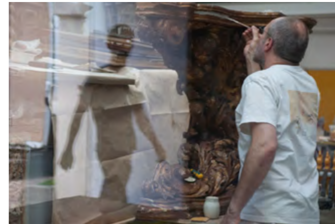
3 Ateliers Gohard, doreurs à Paris, France 2011