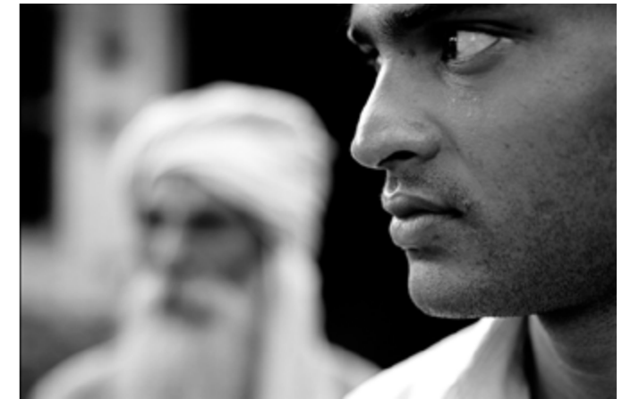
4 © Tiziana et Gianni Baldizzone, Shyam et le Guru, Inde 2012