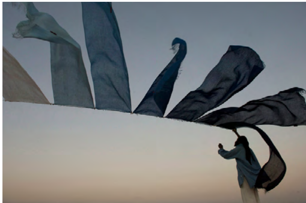
2 © Tiziana et Gianni Baldizzone, Aboubakar Fofana, calligraphe, créateur d'indigo, Mali 2011

Pour toutes autres demandes d'images en service de presse, veuillez contacter : Christine Paulvé - 06 80 05 40 56 - christinepaulve@me.com